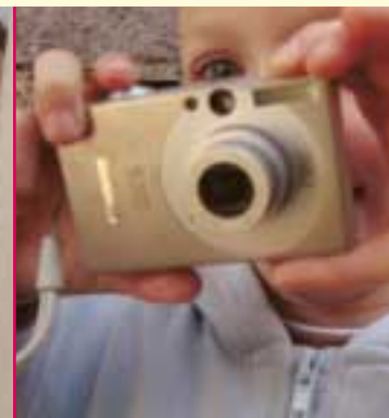
"Klik, jeg fik dig!"

de forsigtighed og begynder at åbne op. Der er stor interesse for at tegne på de bærbare, og i det kreative værelse med tilbuddene om skuespil, rollespil, eller se hinanden live på det store tv eller i et spejl på væggen. Hverken voksne eller børn synes at blive trætte af at prøve kostumer og skuespilvariationer: Nogle af dem filmer, men pludselig lægges kameraet til side, og alle er med i præstationen, "... alt efter behag!".