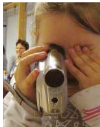
"Ja det er sådan man laver film. Når jeg er voksen vil jeg være kameramand."

På førstesalen er der et "hyggerum" hvor de små kan hvile sig. Atmosfæren i lokalet er understreget af stille musik og hyggelige madrasser på gulvet. Her planlægger vi at udbyde diverse materialer til at lave mandolaer. Med hjælp fra den stille musik kan børnene slappe af her. De endelige produkter af deres koncentrerede arbejde kan herefter fotograferes. Billederne kan uploades på computeren, printes eller sendes til venner på mail. Et andet vigtigt sted på første sal er kreativitetstværelset: Traditionen i dette værelse er at klæde sig ud, spille skuespil, rollespil og skabe musik. Vores gæster skal også have disse muligheder, og de har et kamera hvormed de kan optage deres skuespil eller se hinanden "live" på det store tv.