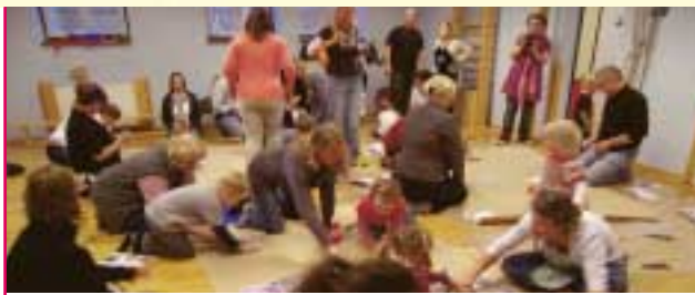
Alle billeder/tegninger gøres til plakater.

En anden speciel ordning i børnehuset er at børnene tilbydes to eller tre alternative pædagogiske aktiviteter hver dag som de selv kan vælge. Ved starten af projektet MediaPlayingCommunities, men uafhængigt af det, planlagde teamet i børnehuset og pædagogerne deres fokus dette år på læring omkring medier. Hensigten var at tilbyde børnene muligheder for at lære sprog og rækkevidde for designet af forskellige medier, såvel traditionelle som moderne. Som følge heraf har børn og voksne brugt computere, digitalkameraer og videokameraer i den daglige praksis, men også skabt en avis og billedbøger sammen. De producerede en film om “Räuber Hotzenplotz”, som er en populær børnebog i Østrig, de har interviewet hinanden og lavet videooptagelser og taget utallige billeder De har endda besøgt redigeringsrummet på en stor avis i Graz.