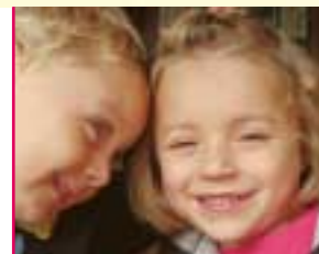
“Jeg tager et billede af dig.”