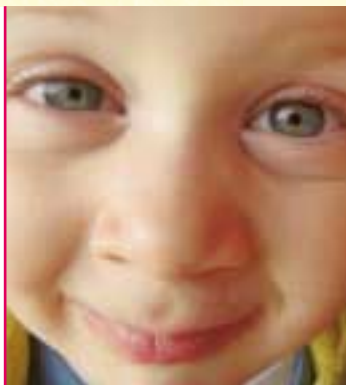
"Fang mig hvis du kan!"

Børn og voksne leger "gemmeleg" og "fang mig hvis du kan" i gymnastiksalen. Børnene løber rundt og forsøger at flygte. Et barn eller en voksen forsøger så at fange dem ved at tage et billede. Så snart det lykkes er barnet fanget. Ved velkomstbuffeten mødes alle og begynder at snakke. Langsomt mister vi alle den indledende