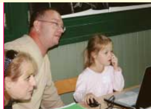
Børnene elsker at male med "Paint".