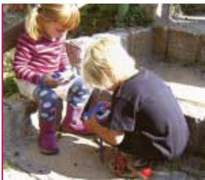
Vi “fanger” firben med kameraet: De er så hurtige at du ikke engang kan fange dem.