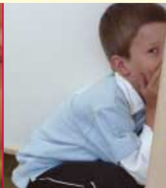
"I ser mig ikke!"