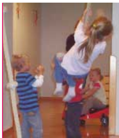
"Har mor taget et billede til at vise derhjemme?"

I gymnastiksalen får børnene i børnehuset som regel lov til at lave øvelser hele dagen. Der er særlige gymnastikredskaber til børnene: Reb, ribber og meget mere. Vores gæster vil blive tilbudt brug af alle disse faciliteter. Det kan så filmes og fotograferes når man løber, klatrer eller hopper.